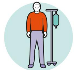
Eher Menschen mit Vorerkrankungen

Quelle: https://www.zeit.de/wissen/gesundheit/2020-02/coronavirus-sars-cov-2-risiko-symptome-schutz-rechte-faq